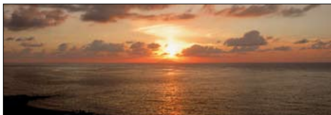
Il mare di Schiavonea