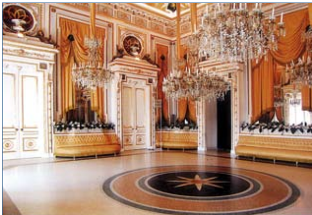
Il Salone degli Specchi del Castello Ducale