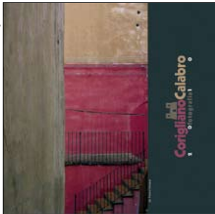
L'immagine di copertina della manifestazione 2010